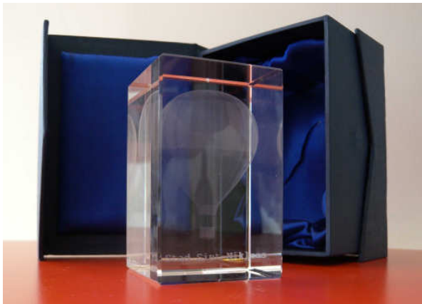
Prijs Stad Sint-Niklaas voor de algemene laureaat

Dat de Beverse Filmclub een topclub is werd weer bevestigd. Na 2014 en 2015 werd de Beverse Filmclub door de Vereniging amateurneemsters Oost-Vlaanderen (VAKOV) in 2016 weer uitgeroepen tot Beste Filmclub van Oost-Vlaanderen.