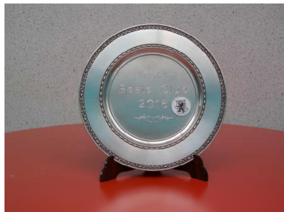
Trofee beste club van Oost-Vlaanderen