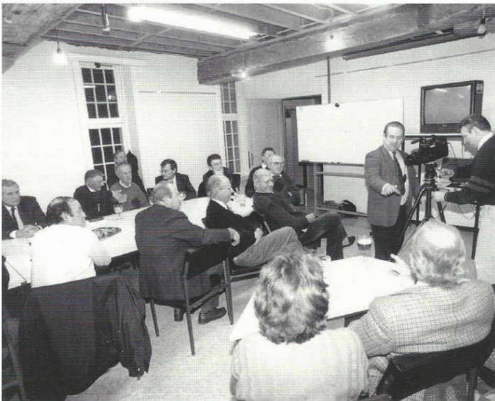
Zo zag een clubavond bij de BFV er in 1993 uit.

Roger: "Ook éénminuutfilmpjes wordt al eens in clubverband gemaakt. "5000 MegaWatt"